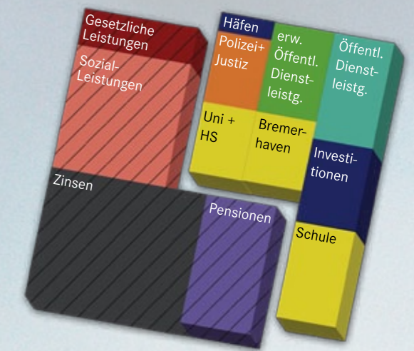
Der Bremer Haushalt nach der „Schuldenbremse“

Auch ein aktuelles, vom Senat in Auftrag gegebenes Gutachten (Deubel, 2010) rechnet vor, dass die Ausgaben Bremens 2020 in heutiger Kaufkraft nur noch 3,126 Mrd. Euro betragen dürften. Projiziert man steigende Zinsen und Versorgungsleistungen sowie gleichbleibende Sozialleistungen und gesetzliche Leistungen in diese Gesamtausgaben, so ergibt sich folgendes Bild: